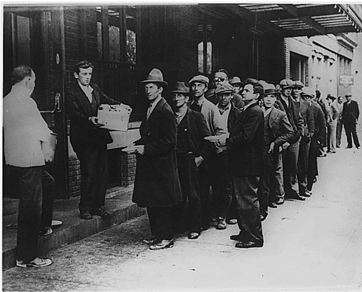
Fronta na chleba v New Yorku, 1932