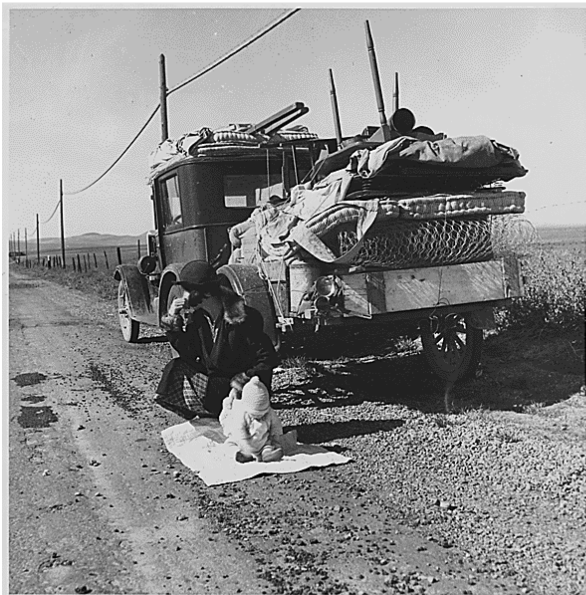
Route 66 do Kalifornie, kolem roku 1935