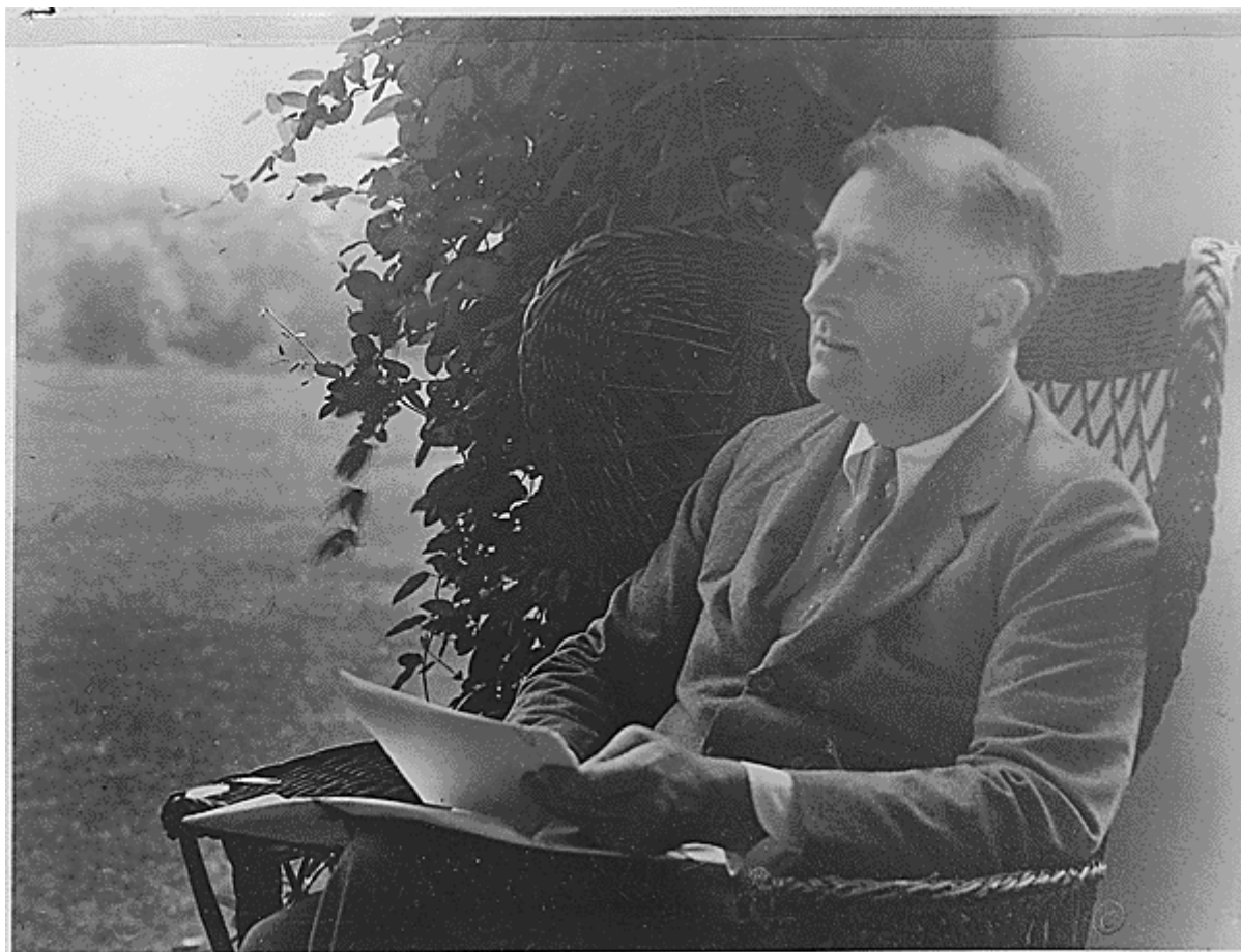
Hyde Park, New York (1931)