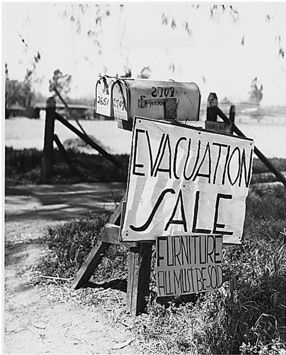
opouštění farem, kolem roku 1933